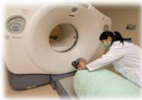
正子電腦斷層掃描