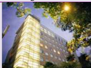
永越健康管理中心