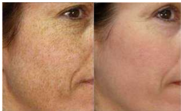
脈衝光 治療前 → 脈衝光 治療後